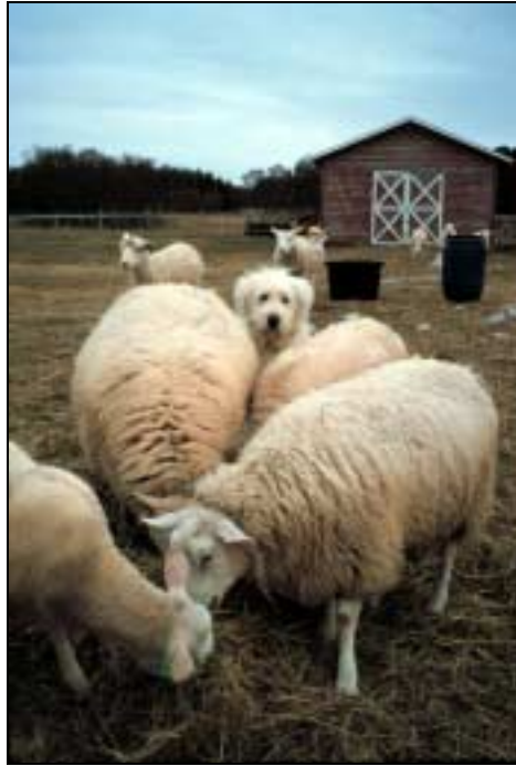
Figur 4.2: Når valpen er ca 4 mnd gammel utvides området og antall sau.