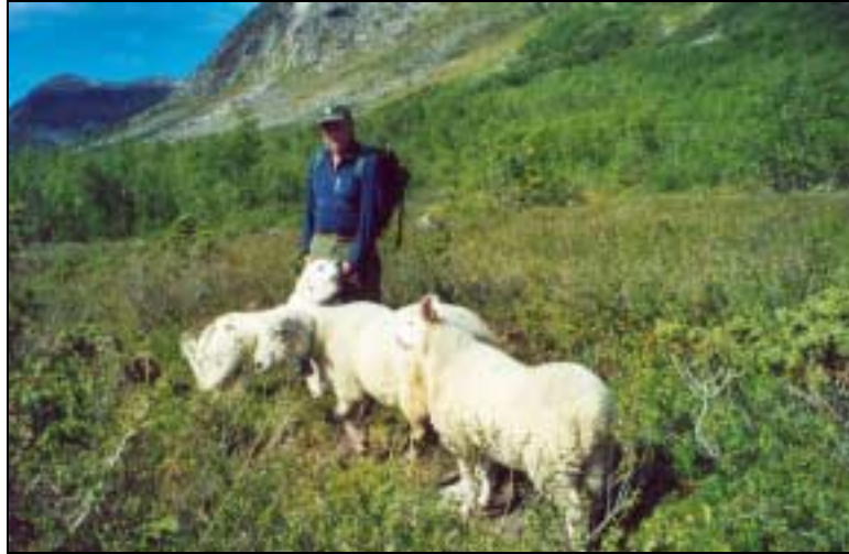
Figur 3.2: Vokterhund på patrulje i Ulvådalen, Rauma kommune.

5. Vokterhunder brukt som gårdsvoktere. Hundene går løse på gården og vokter et område som den oppfatter som sitt territorium. Dette innebærer vokting av sau (som beiter i tilknytning til gården), familien og andre dyr som måtte finnes på gården.