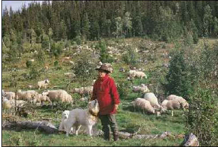
Figur 3.1: Vokterhunder brukt i kombinasjon med gjeting. Fra vokterhundprosjektet i Lierne.

2. Vokterhunder brukt alene med sau på inngjerdet beite. Hundene vokter sauene alene innenfor et inngjerdet beite døgnet rundt og uten mennesker eller gjeterhunder tilstede. Beitet kan være innmark og/eller utmark nært opptil, eller i distanse fra gården.