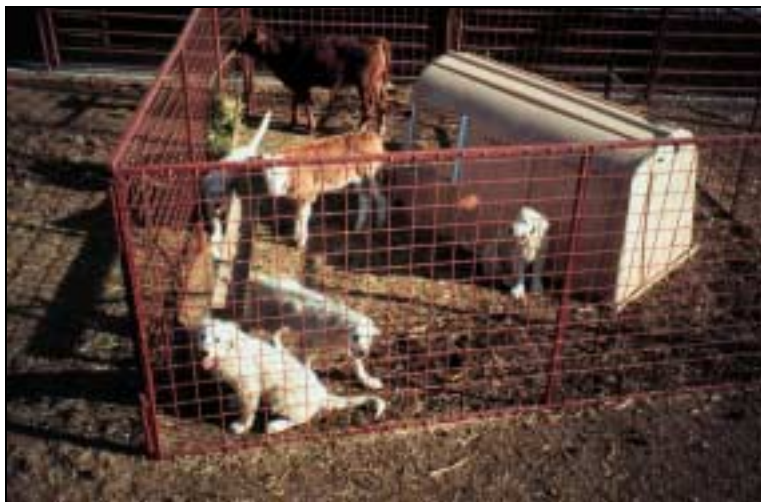
Figur 4.1 PREGING AV VALPER PÅ KJØTTFE. PRINSIPPET BLIR DET SAMME FOR SAU.

Det må følges nøye med slik at valpen ikke begynner å herje med sauene eller at sauene er for hard med hunden (se kap. 5). Det må ikke tillates at hunden leker med sau. Tren valpen på innkalling i forbindelse med føring. La den også forstå hva "nei" betyr. Dersom sosialiseringprosessen går greit, vil valpen vise underdanig atferd overfor sauene; den vil slikke sauene i munnvikene og vil søke trygghet hos sauene dersom den blir skremt.