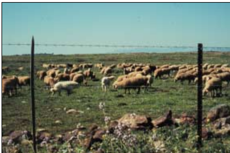
Figur 3.1: Vokterhunder brukt på inngjerdet beite i Israel.

2. Vokterhunder brukt alene med sau på inngjerdet beite. Hundene vokter sauene alene innenfor et inngjerdet beite døgnet rundt og uten mennesker eller gjeterhunder tilstede. Beitet kan være innmark og/eller utmark nært opptil, eller i distanse fra gården.