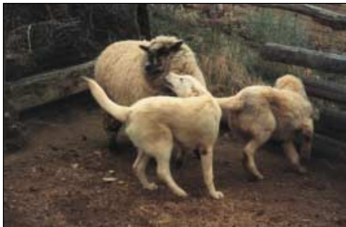
Figur 5.1: En godt preget valp som viser tydelige underkastelsessignaler.