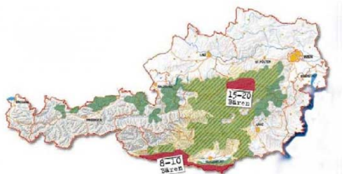
Österreich-Karte: BEV – Bundesamt für Eich- und Vermessungswesen

25 bis 30 Bären leben derzeit in Österreich. Die steirisch-niederösterreichischen Kalkalpen zwischen Ötscher und Hochschwab sowie die Kärntner Karawanken, die Gailtaler und die Karnischen Alpen sind die bevorzugten Aufenthaltsgebiete. Aber auch in Salzburg und Tirol sind im Jahr 2002 überraschend Bären aufgetaucht. Die Bärin Vida - sie stammt aus einem italienischen Wiederansiedlungsprojekt - überschritt den Brenner und wanderte bis Osttirol. Ein bisher noch nicht identifizierter Braunbär riss in den Salzburger Tauern einige Schafe. Mehr dazu auf Seite 2 und 3.