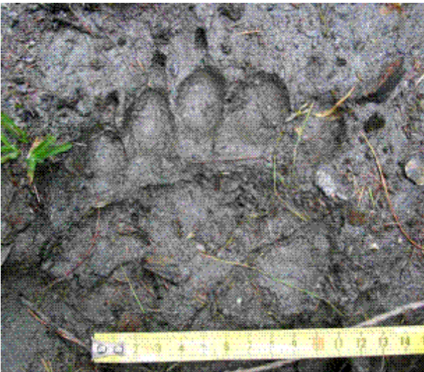
Die Breite des Tatzenabdruckes (10cm) sowie die Eindringtiefe lassen darauf schließen, dass es sich bei dem Bären um ein Jungtier mit 2,5 Jahren handelt welches kaum mehr als 70 kg wiegt.